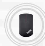
ThinkPad Precision kabellose Maus