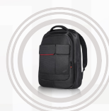
ThinkPad Professional Rucksack